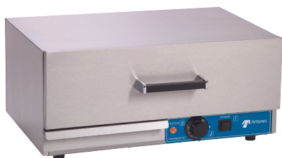
WD-20 with water tray