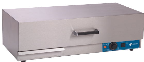
WD-35A with water tray

Preparato in precedenza ma con un sapore come se fosse stato fatto su ordinazione. Il Cassetto Scaldapanini mantiene il prodotto alimentare fresco e delizioso per i clienti. E' dotato di un termostato per regolare la temperatura richiesta per il tuo panino.