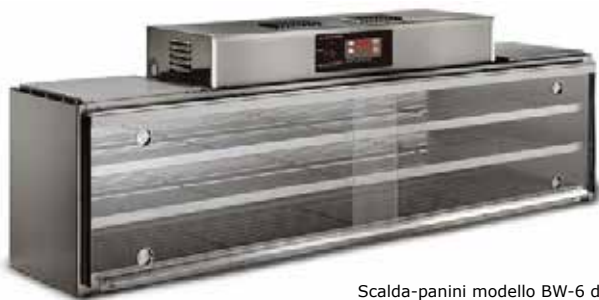
Scalda-panini modello BW-6 da tre scaffali che può contenere 6 vaschette per scaffale.