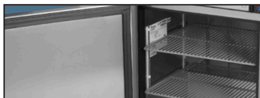
Rivestimento in acciaio inossidabile