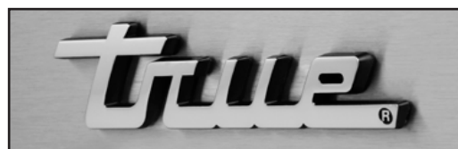
Logo Spec Series®