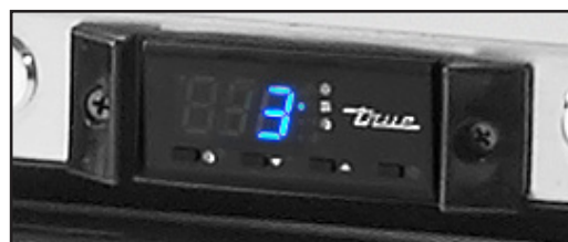
Display digitale della temperatura esterno