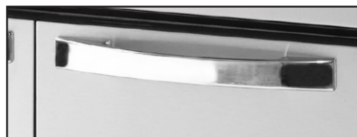
Maniglie in metallo pesante